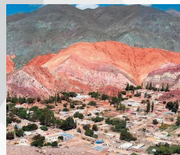
QUEB. DE HUMAHUACA